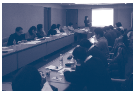
One presentation scene at the GCOE History Seminar.