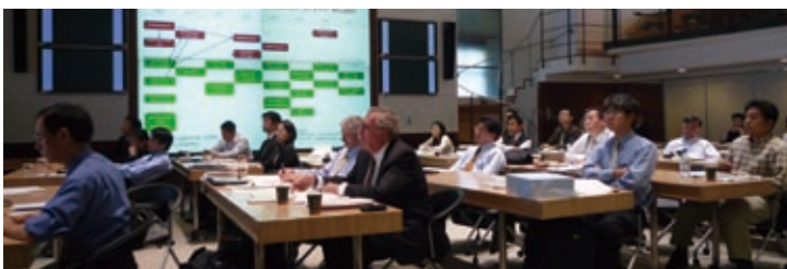
Scene at the G-Sec Lab where participants listened to presentation seriously.