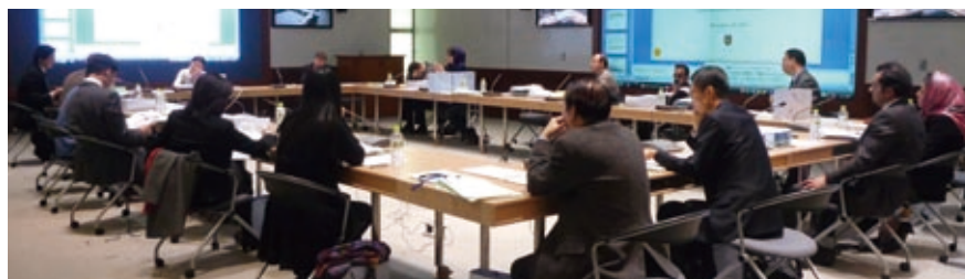
One scene at the G-Sec Lab where participants discussed each other’s research finding.