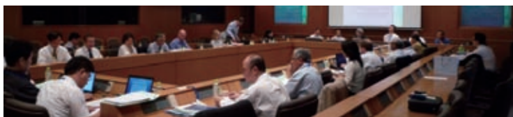
One scene of participants in AEP meeting

The Asian Economic Panel Meeting took place September 6-7, 2009 at the Keio University Mita Campus. This international conference is a venue for deliberations on Asian policy, centered on Asian studies researchers and research organisations. The meeting had a total of 13 presentations, including three special reports.