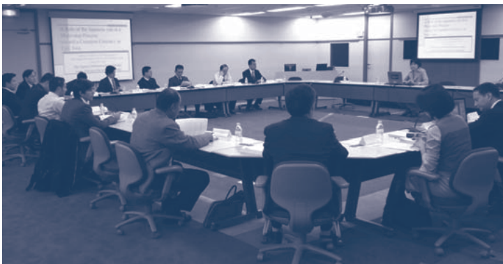
Scene at the conference where participants from all over the world gathered and engaged in lively discussions.