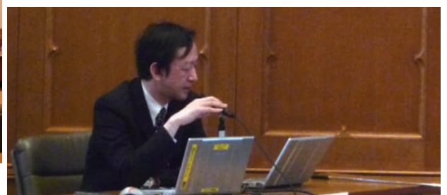
Professor Tetsuji Okazaki (University of Tokyo)

Reports in the third session "Political Changes and Its Effects on Trade" adopted the Ottoman Empire, colonial India and the Qing dynasty as examples to discuss how the expansion of Western political and military presence influenced changes in regional trade systems and market order through trade treaties and colonial control.